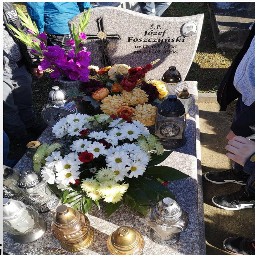
Grób Józefa Foszczyńskiego nauczyciela muzyki ludowej